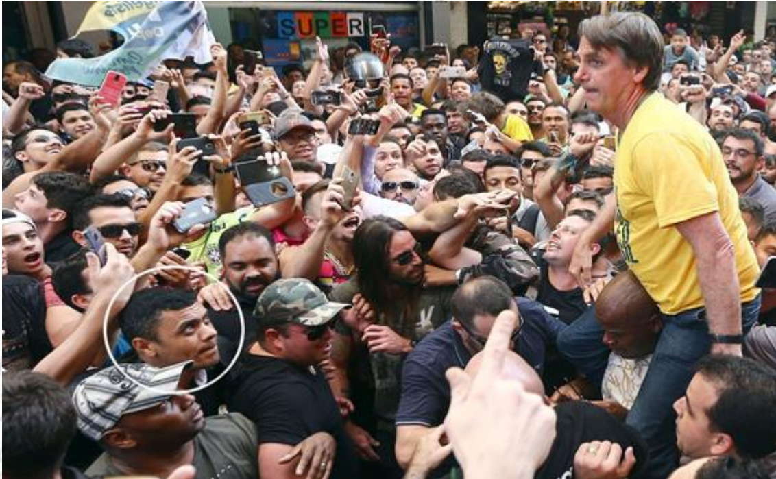
Fonte: Fabio Motta/Estadão Conteúdo (06.set.2018) – Na foto, ambos, o Bispo e o Messias, instantes antes da facada – https://www.cnnbrasil.com.br/politica/delegado-do-caso-adelio-narra-duas-reunioes-com-bolsonaro/

Institucionalizou-se, inclusive, a falsa equivalência de dejetos biográficos ao teor da produção teórica e da trajetória profissional de muita gente anônima, cientistas, artistas, políticos, influencers , ofertando-se à sociedade contornos distorcidos para a edificação do que deveria ser um novo e melhor 'normal', que sobreveio sem os escrúpulos prometidos (BARROS FILHO, 2019), e mal acompanhado de uma novilíngua (MARTINS, 2023), de um ministério da verdade (MATTOS, 2023) e de um repaginado Estado de exceções (STF e os seus eternos).